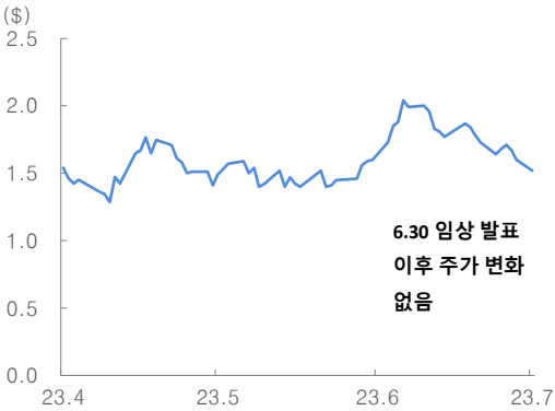
그림 3. Agenus 주가: 임상 발표 이후에도 큰 변화 없음